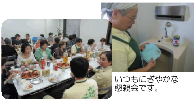
いつもにぎやかな懇親会です。