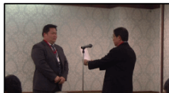
パートナー賞:福岡産業さん