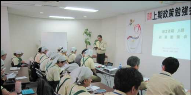
●前期業績報告及び、今期の政策発表 西依社長