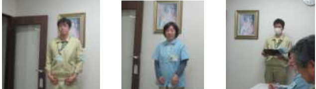
ESチーム CSチーム 環境整備チーム 各チームリーダーからチーム活動を報告