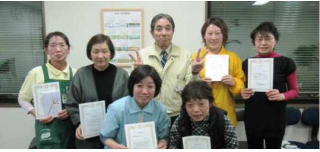
社長と受賞者の皆さん。