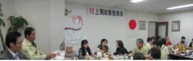
勉強会後の懇親会