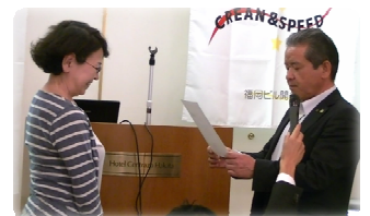
◆マスタース技能会表彰