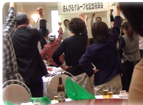
◆ガンバローコール